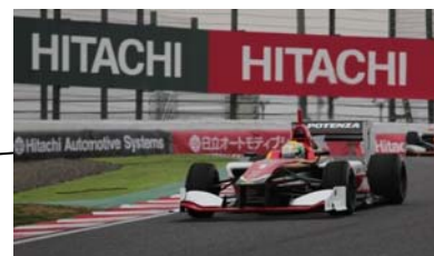
和文表記: 日立オートモティブシステムズシケイン 英文表記: Hitachi Automotive Systems Chicane

当社は、モータースポーツへのスポンサーシップを通じて、ブランドの更なる浸透を図ると共に、モータースポーツの振興に貢献していきます。