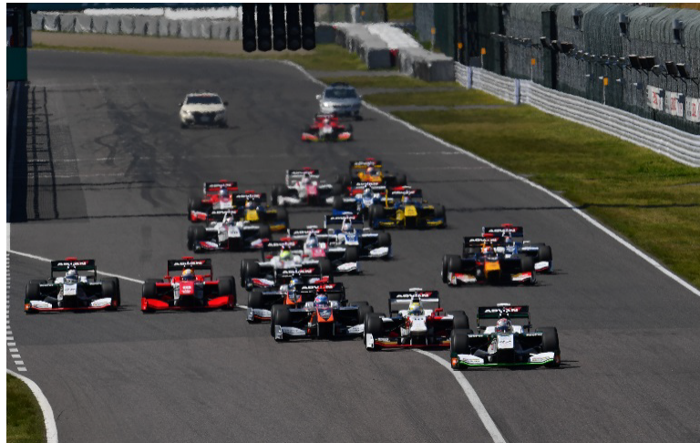
2017年開幕戦のスタートシーン(鈴鹿サーキット)