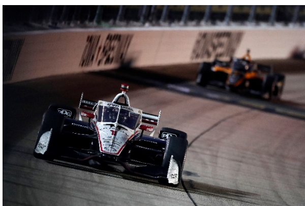
トップを快走するジョセフ・ニューガーデン選手のマシン

日立オートモティブシステムズは今後も、インディカーレースをはじめとしたモータースポーツへのスポンサーシップを通じて、日立ブランドのさらなる浸透を図ると共に、モータースポーツの振興に貢献していきます。